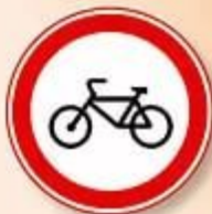
“ДВИЖЕНИЕ НА ВЕЛОСИПЕДАХ ЗАПРЕЩЕНО”